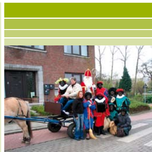
Sinterklaasoptocht (november 2005).