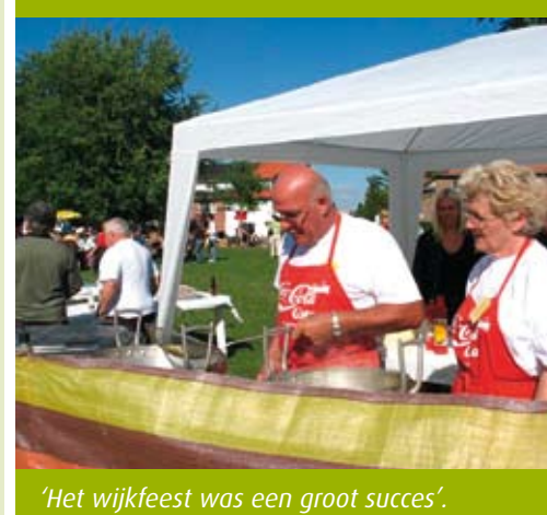
'Het wijkfeest was een groot succes'.