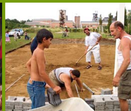
Samen werken schept een band. Vaders leggen samen een basketterrein aan.