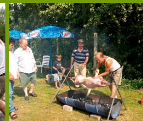
Buurtbewoners organiseerden een barbecue. Samen eten brengt mensen dichter bijeen.