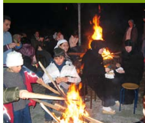
Samen feesten. Bewoners van de Waterstraat vieren de inhuldiging van hun zelf aangelegd basketterrein.