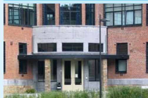
'Onze nieuwe huisvesting'.

Ons telefoonnummer, faxnummer en internetadres blijven behouden. Je bent er meer dan welkom.