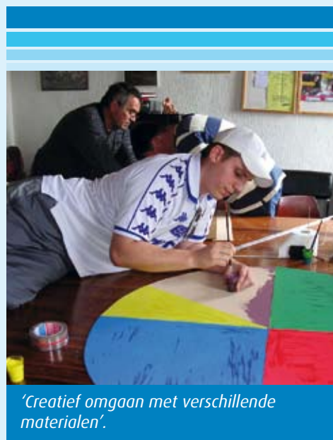
'Creatief omgaan met verschillende materialen'.

zijn. 'Spiegels' had voor de groep ook de betekenis van reflectie. Met gebroken spiegels verkregen we een vertekend beeld van de realiteit. Geverfde schoenen op een catwalk gaven de evolutie van het leven weer. Dat alles werd gereflecteerd in spiegelende voorwerpen. Door onze leefomgeving creatief in beeld te brengen, gingen we kritischer nadenken over onze situatie en groeide ook het besef dat we in staat zijn om eraan te werken."