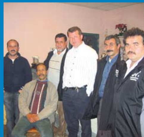
Turkse en Marokkaanse buurtvaders in Meulenberg.