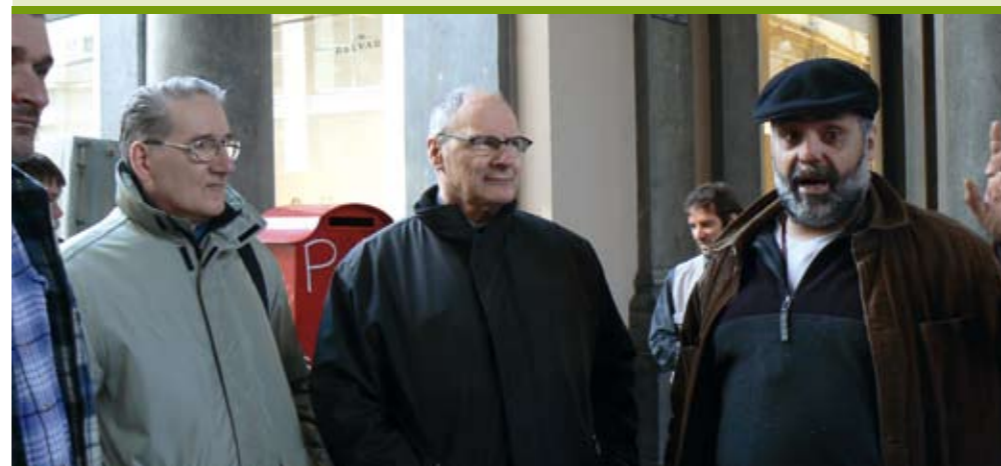
Op uitstap met 'De Steen' naar Brussel

Precies dat streefdoel wil SOMA in Maasmechelen waarmaken: fungeren als spreekbuis voor mensen in armoede en op die manier in actie komen tegen maatschappelijke onrechtvaardigheden."