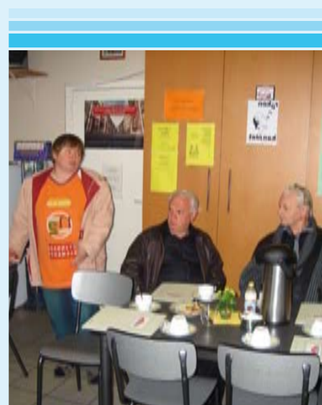
Voyageurs op bezoek bij 'Wasda'

Het nieuw gemeentelijk reglement op kamers en de sanering van de logementhuizen in Genk leek aanvankelijk een goede zaak. De slechtste logementhuizen werden gesloten. De anderen moesten aangepast worden aan