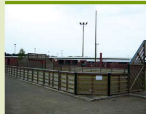
The place to be, de 'pitch'.

Onderzoek wijst uit dat veel jongeren het doelloos rondhangen als één van de favoriete vrijetijdsactiviteiten beschouwen. Niet omdat ze niets anders te doen hebben, maar omdat ze het gewoon plezant vinden om met leeftijdsgenoten te vertoeven op een 'eigen' plek. Wandel maar eens door Peerse buurten zoals de Roshaga of de Eilandsvelden, waar je 'uitgedoste' trefplaatsen vindt, met plaats voor sport en spel voor klein en groot.