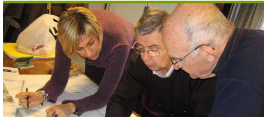
De werkgroep brengt de knelpunten in kaart

Andere werkgroepen zijn bezig rond dorpsverfraaiing en het sociaal leefklimaat. Er zijn ook plannen in de maak voor een artistiek project dat het dorp sterker op de kaart moet zetten.