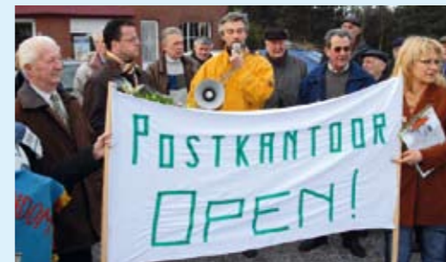
‘De bewoners blijven strijden voor een postkantoor in Boxbergheide’.

“We zijn zelfs in Brussel actie gaan voeren. We spraken met iemand van het kabinet van staatssecretaris voor overheidsbedrijven Bruno Tuybens. Jammer genoeg leveren deze contacten niet veel op, want de beslissingen zijn al gevallen. Toch blijven de bewoners strijden voor een deeltijds postkantoor in Boxbergheide.”