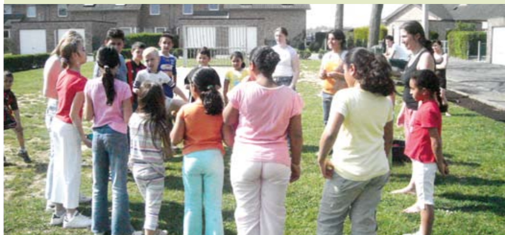
“De kinderen zijn altijd laaiend enthousiast”.