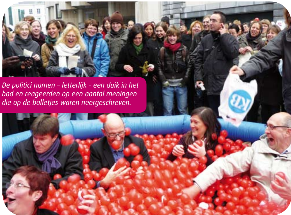
De politici namen - letterlijk - een duik in het bad en reageerden op een aantal meningen die op de balletjes waren neergeschreven.

Tijdens de ludieke actie "Een boodschap met ballen" op 2 december trok de sector Samenlevingsopbouw enkele Vlaamse politici in een ballenbad. Met dit initiatief wou de sector de stem van maatschappelijk kwetsbare groepen luider laten klinken en onze beleidseisen in de aanloop naar de regionale verkiezingen kracht bijzetten. In de aanloop naar deze actie toerde RIMO Limburg eind november gedurende een week langs 30 opbouwprojecten in een opvallende auto vol rode ballen. We vroegen de mensen om hun meningen en verwachtingen op balletjes neer te schrijven. We namen de ballen mee naar de Limburgse slotdag in Genk en het nationale ballenbad in Brussel. De sector overhandigde ook een eisenpakket aan de politici. De politiek wordt opgeroepen om te investeren in de participatie van bewoners binnen de sociale huisvesting en in een experiment inzake duurzaam en energiezuinig wonen voor kansengroepen. Ook de erkenning en subsidiëring van buurtwerk en de participatie van kansengroepen in het lokaal sociaal beleid behoren tot de eisen.