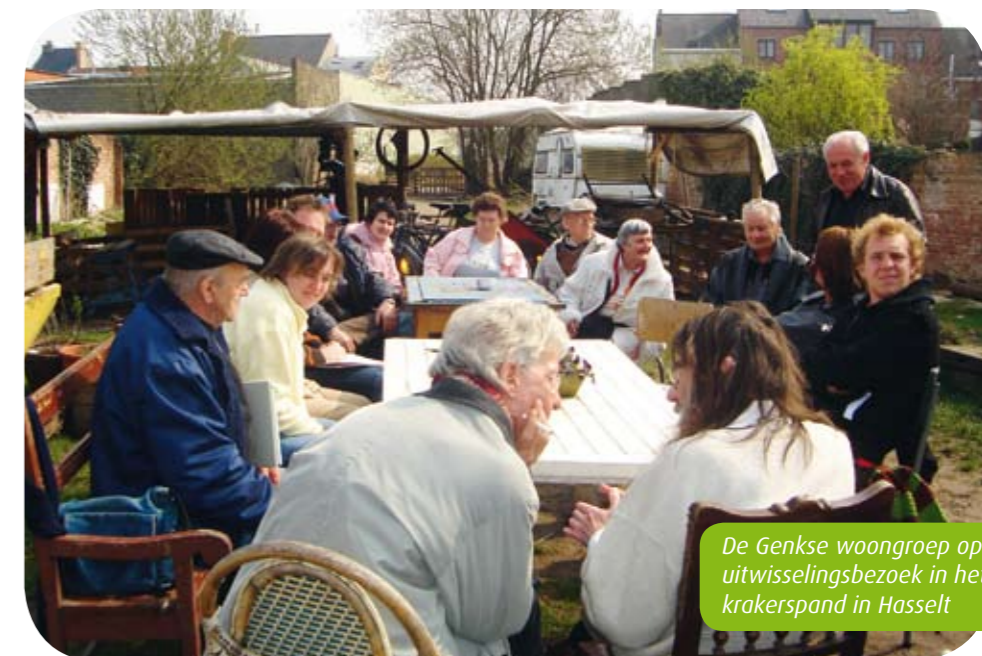
De Genkse woongroep op uitwisselingsbezoek in het krakerspand in Hasselt

"Ons belangrijkste resultaat is dat de bouw van 16 nieuwe kamers door sociale huisvestingsmaatschappij Nieuw Dak gerealiseerd werd in nauwe samenwerking met ons. Er staat nu een tweede gelijkaardig project op stapel in logementhuis Continental in Waterschei. Een ander belangrijk resultaat is dat het beleid in Genk de woonproblematiek erkent. Anderzijds voel ik een machteloosheid. Wanneer de huurprijzen onwettig opslaan, dan kan de huurder wel een proces aanspannen. Maar huurders hebben vaak schrik hun woonst te verliezen. Bovendien kost procederen geld en dat hebben mijn mensen niet. Maar de balans van elf jaar werken is alles bijeen toch positief."