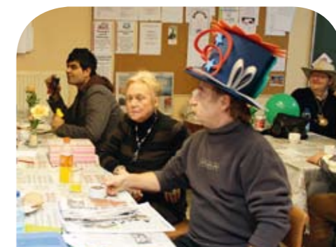
'Trefcentrum Soma: Dankzij een structurele samenwerking met het OCMW bouwden we in Maasmechelen een permanente werking uit.'

In Maasmechelen bouwden we samen met mensen met een laag inkomen het diensten- en ontmoetingscentrum Soma uit. We achtten het noodzakelijk het