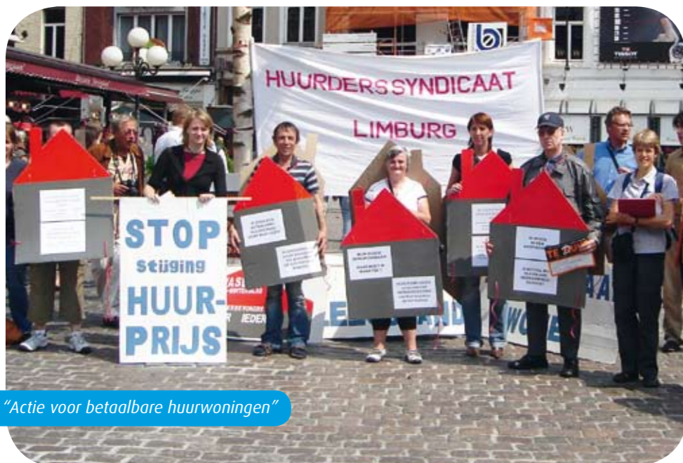
"Actie voor betaalbare huurwoningen"

GENK - Kamerwonen is zowat de goedkoopste woonvorm. Vaak is het het enige woonalternatief voor alleenstaande mannen met een laag inkomen. Maar ook een woonvorm met weinig comfort en nogal wat wantoestanden. RIMO Limburg werkt sinds 1997 met kamerbewoners in Genk. Nu bouwen we ons engagement langzaam af. Tijd voor een balans.