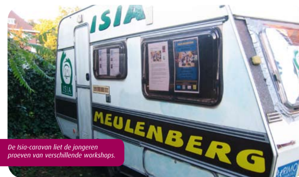
De Isia-caravan liet de jongeren proeven van verschillende workshops.

Houthalen-Helchteren - Meulenberg - In april 2010 kregen de eerste ideeën over een sociaal-artistiek project in Meulenberg in de schoot van RIMO Limburg vorm. Het kind kreeg al snel een naam 'ISIA' wat staat voor Iedereen - Samen - Ingenieur - Artiest. In mei kwamen verschillende partners samen om het project op de rails te krijgen. Het project werd steeds concreter, de verscheidene partners werkten samen en daaruit kwamen ingenieuze voorstellen naar voren zoals