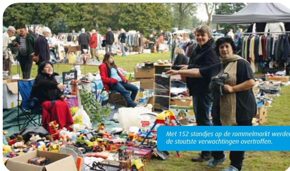
Met 152 standjes op de rommelmarkt werden de stoutste verwachtingen overtroffen.