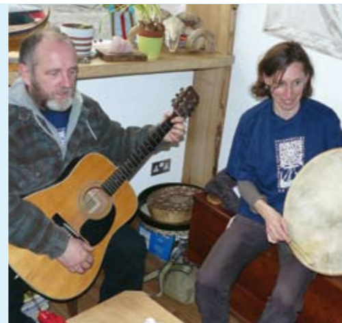
Galgael is niet zomaar een opleidingsproject. Het is een werkplaats tegen vervreemding.

In een klein keukentje is een man een warme maaltijd aan het bereiden. "We hebben een beurtrol om te koken", vertelt hij. Het past perfect in de sfeer die Galgael uitstraalt. Dit is geen louter opleidingsproject. Dit is een werkplaats tegen vervreemding. Geen seriewerk hier, geen standaardisering. Elk stuk dat hier gemaakt wordt, is uniek.