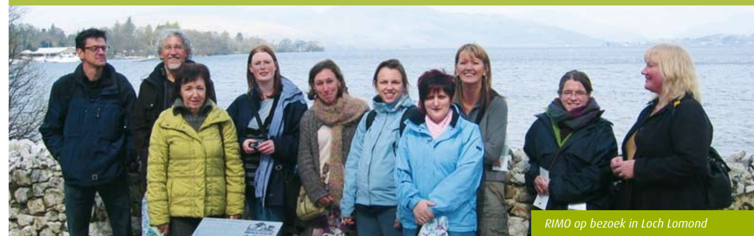
RIMO op bezoek in Loch Lomond

Intussen zijn nagenoeg alle actieplannen uitgevoerd, maar steekt een nieuw probleem de kop op: sociale verdringing. Door de wonderlijke schoonheid van het gebied, kopen 'rijke Engelsen' een groot deel van het vastgoed op. De eigen bevolking, vooral jongeren, verhuizen noodgedwongen naar de steden. Een nieuw opbouwwerkprogramma, The Community Futures Programme 2008, dat op dezelfde grote schaal loopt, wil op die nieuwe uitdaging antwoorden bieden.