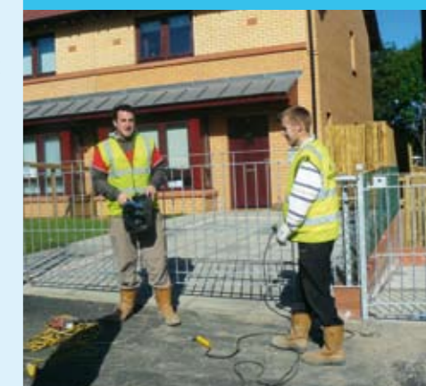
Lokale jongeren gaan aan de slag in hun buurt

sociale huisvestingsmaatschappijen. Bij elk groot project (nieuwbouw of renovatie) nemen ze in het contract op dat de aannemers twee jongeren uit de wijk in dienst moeten nemen voor drie jaar. Deze jongeren volgen dan een beroepsopleiding gedurende één dag per week. De vier andere dagen werken ze mee aan het project. Op die manier verhogen de kansen van deze jongeren om in de toekomst op de arbeidsmarkt aan de slag te gaan.