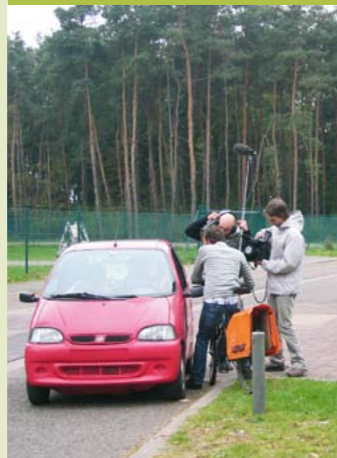
De acteurs ijverig aan het werk

De samenwerking tussen de verschillende wijkorganisaties resulteerde zo in een mooi eindproduct.