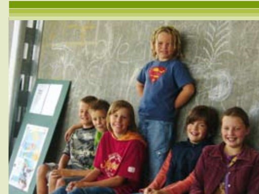
Belangrijk hierin is het vinden van voldoende draagvlak bij de bewoners

Belangrijk hierin is het vinden van voldoende draagvlak bij de bewoners. Buurtsport is zo een voorbeeld dat in samenwerking met vrijwilligers uit de buurt en met de sportdienst op gang werd getrokken. Het mag immers niet de bedoeling zijn dat initiatieven voor hen op touw gezet worden, maar wel mét hen. De dynamiek rond het plein moet uitgaan van de bewoners en hun competenties.