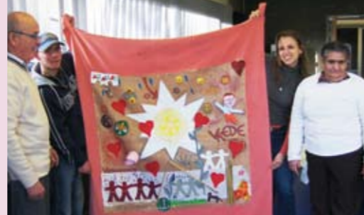
Ons kunstwerk zit vol kleine details die 'grote' waarden voor onze groep inhouden, zoals verbondenheid.