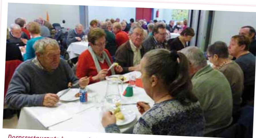
Dorpsrestaurants brengen informatie en dienstverlening dicht bij de mensen.

Het dorpsrestaurant voldoet aan een primaire noodzaak. Eten moet iedereen. De truc is om daarmee mensen samen te brengen. Die ontmoeting maakt dat mensen oog krijgen voor de problemen van tafelgenoten en die mee willen oplossen, zodat de dorpsgemeenschap hechter wordt. Bewoners worden als vrijwilliger geactiveerd om het restaurant te laten draaien en vinden op die manier erkenning en waardering. Bovendien zijn dorpsrestaurants een springplank voor nieuwe voorzieningen én brengen ze