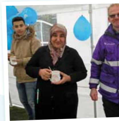
In soepoeken trakteren we buurtbewoners op een kop soep.

Veelvuldig zichtbaar zijn, kleine ontmoetingen en contacten zijn de sleutelwoorden als we spreken over presentiebenadering. Het betekent letterlijk intens deelnemen aan het dagelijkse leven in de omgeving van de mensen die men wil bereiken. Herkenbaarheid is daarbij een grote troef, daarom ook dat de opbouwwerkers in Genk die in contact willen komen met logementsbewoners steeds een rode sjaal aandoen als ze op straat of in cafés rondhangen. Samen met de affiches en flyers die uithangen vergroten ze hun zichtbaarheid in Genk. FV