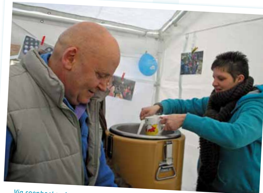
Via soepoeken komen buurtwerkers in contact met wijkbewoners die ze nog niet bereikten.

Er zijn drie fases die van belang zijn bij het bereiken van mensen in sociaal isolement. Ten eerste moet je de doelgroep vinden. Dit blijkt in de praktijk vaak het moeilijkst te zijn.