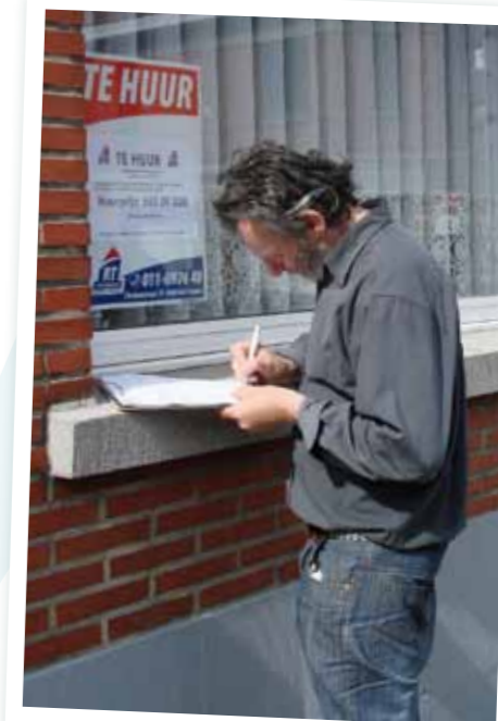
De huurwandelaars leggen de grote nood aan betaalbare en sociale woongelegenheden bloot.

Met de rondgang leggen de huurwandelaars de grote nood aan betaalbare en sociale woningen bloot. Bij de sociale huisvestingsmaatschappij Nieuw Sint-Truiden staan meer dan 1.000 kandidaten op de wachtlijst en in Vlaanderen zijn dat er ruim 100.000! ONDERDAK pleit voor een