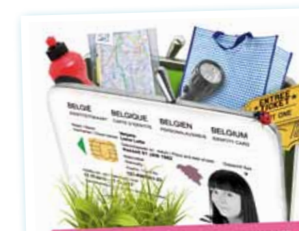
De e-portemonnee is een elektronisch spaar- en beloningssysteem waarbij inwoners met duurzaam en milieuvriendelijk gedrag punten verdienen.

initiatieven ontstaan tussen bewoners en hun omgeving.' KF