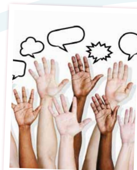
We reiken mensen de hand om een leven op te bouwen buiten de vier muren.

Onze aanpak vereist een positieve benadering van de doelgroep, niet vertrekkend vanuit problemen, niet-kunnen, niet-zijn en niet-hebben, maar vanuit een krachtenperspectief. Participatie binnen de contouren van onze werking heeft een positieve invloed op de persoonlijke ontwikkeling, sociale vaardigheden ... waardoor deelnemers hun vleugels weer durven uitslaan en zich een plaats in de samenleving weten te verwerven.