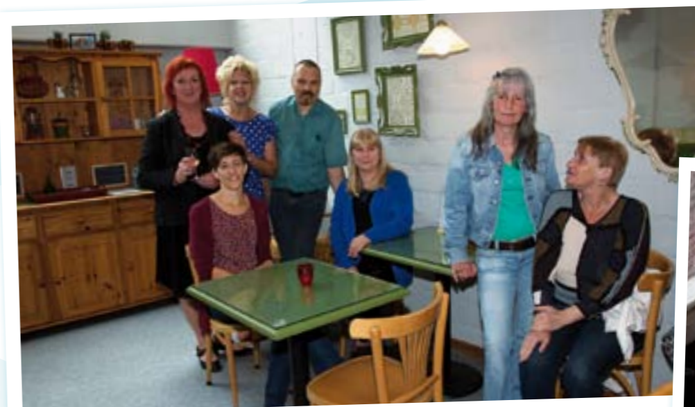
Een luisterend oor, doorverwijzing of oplossing. Praten met anderen helpt. Je leert uit elkaars problemen.