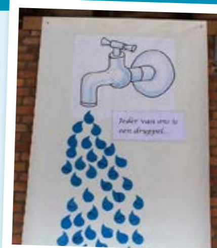
Basisschool De Horizon: 'Wanneer leerkrachten en schoolteams inzicht hebben in de leefwereld van kansarme gezinnen, kunnen ze hun onderwijspraktijk er beter op afstemmen en zo de leerkansen van onze leerlingen vergroten.'

Kansarmoede aanpakken is geen opdracht van een school alleen. Scholen kunnen hier echter wel een belangrijke rol in spelen. Wanneer leerkrachten en schoolteams inzicht hebben in de leefwereld van kansarme gezinnen, kunnen ze hun onderwijspraktijk er beter op afstemmen en zo de leerkansen van onze leerlingen vergroten. Het belang van het kind op school staat voor ons steeds voorop. Alleen gaat misschien sneller ... maar samen kom je verder!'