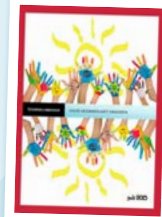
Er bestaat een wirwar van informatie, kortingen, premies ... voor gezinnen met kinderen. Het 'Voordelenboekje voor gezinnen met kinderen' lijst de vele voordelen over vrije tijd, gezondheid, energie, kinderopvang ... op voor ouders in Beringen.