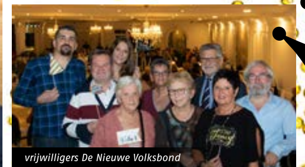
vrijwilligers De Nieuwe Volksbond