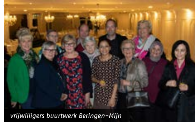
vrijwilligers buurtwerk Beringen-Mijn