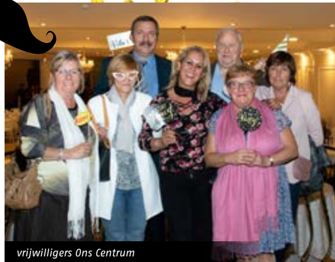
vrijwilligers Ons Centrum