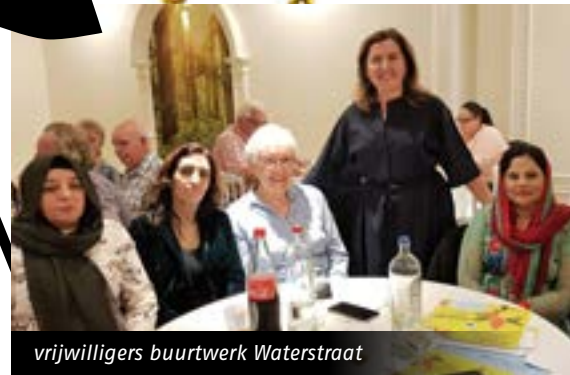
vrijwilligers buurtwerk Waterstraat