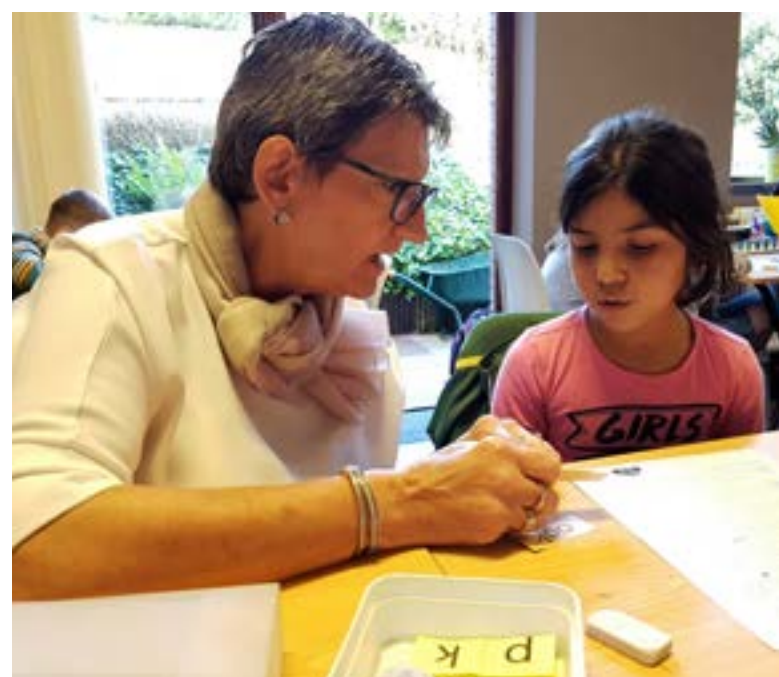
Vicky wil kinderen een goede houvast geven om door te kunnen groeien.