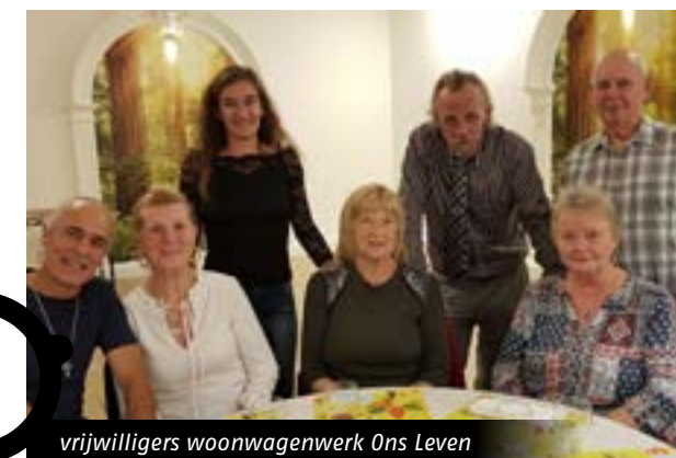
vrijwilligers woonwagenwerk Ons Leven