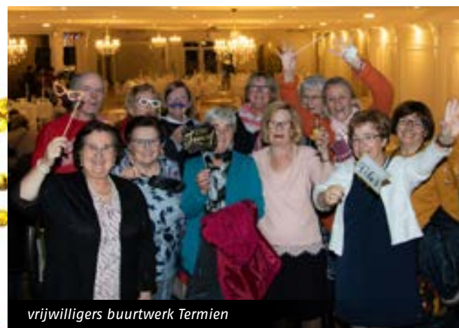
vrijwilligers buurtwerk Termien