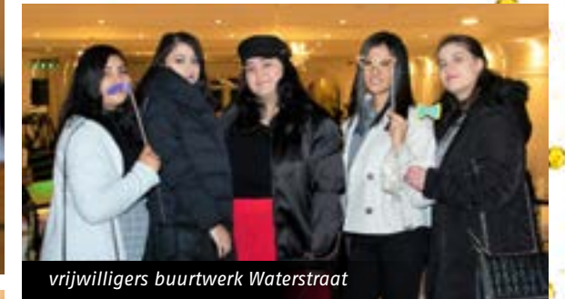
vrijwilligers buurtwerk Waterstraat