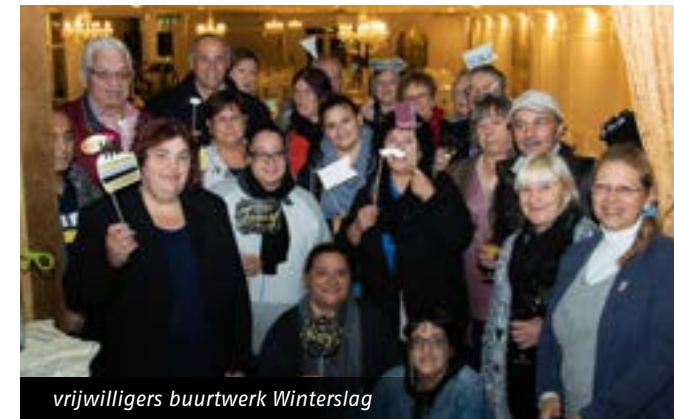
vrijwilligers buurtwerk Winterslag