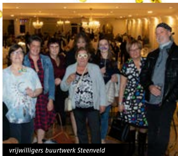
vrijwilligers buurtwerk Steenveld