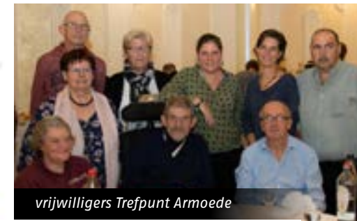
vrijwilligers Trefpunt Armoede