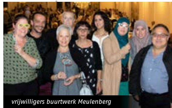
vrijwilligers buurtwerk Meulenberg