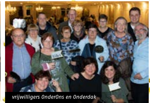
vrijwilligers OnderOns en Onderdak