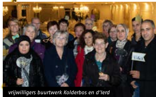
vrijwilligers buurtwerk Kolderbos en d'Ierd