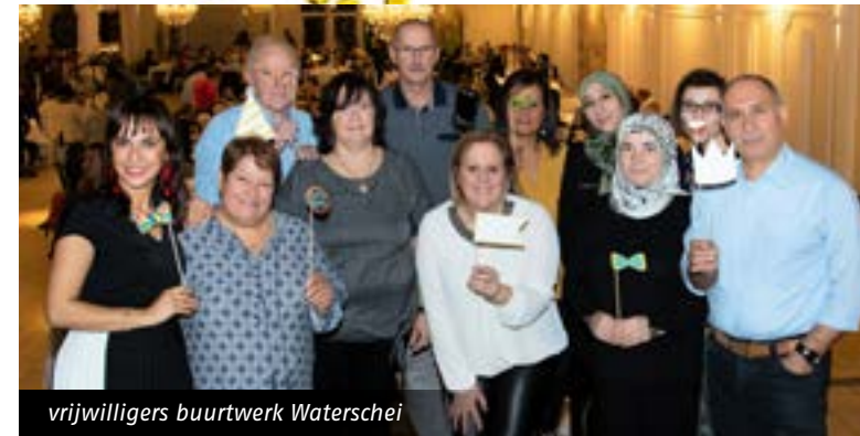
vrijwilligers buurtwerk Waterschei