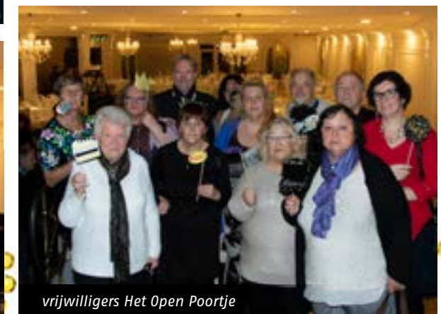
vrijwilligers Het Open Poortje